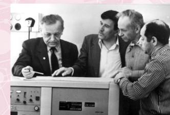
В.А. Коптюг (слева) со спектрометром.

С 1979 г. В.А. Коптюг – академик АН СССР, с 1980 г. – вице-президент Академии и председатель Сибирского отделения АН СССР. В.А. Коптюг уделял особое внимание стратегии опережающего развития фундаментальных исследований и поддержке направлений, составляющих основу научно-технического прогресса. Валентин Афанасьевич активно разрабатывал основы научной стратегии перехода России к устойчивому развитию. Большое внимание ученый уделял проблемам экологии Сибири, Байкала. Много сил и энергии академик В.А. Коптюг отдавал организации