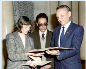
В.А. Коптюг (справа) на вручении ему международной награды: медаль А.П. Карпинского и диплом I степени.