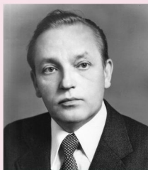
В.А. Коптюг.

Академик Валентин Афанасьевич Коптюг (1931–1997) – выдающийся ученый-химик, видный общественный и политический деятель, директор Новосибирского института органической химии (НИОХ СО РАН), ректор Новосибирского государственного университета (НГУ), председатель Сибирского отделения АН СССР (позднее РАН), вице-президент РАН.