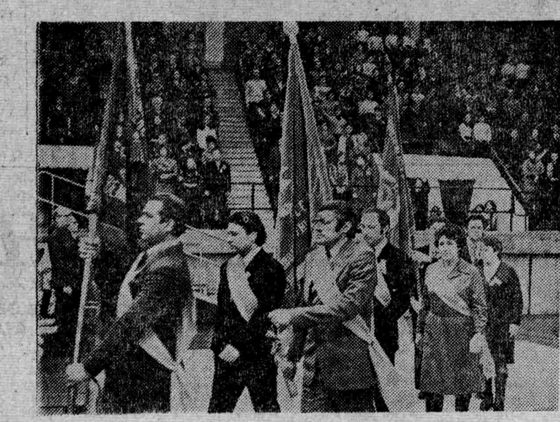
Знамена трудовой славы иркутяны.

ревнования, творческого созидания. Выполняя заветы Ильича, единодушно поддерживая внутреннюю и внешнюю политику Коммунистической партии, трудящиеся Иркутска, как и всей страны, полны решимости добиться значительных успехов на всех участках коммунистического строительства.