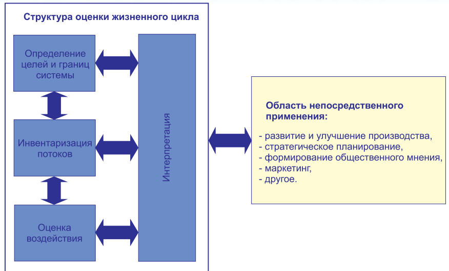
Рис. 2. Общая структура оценки жизненного цикла (по ISO 14040:1997) [9]

Процессный подход входит в методологию системы экологического менеджмента как важный принцип охраны окружающей среды, включающий экологические требования в общий список требований к производствен-