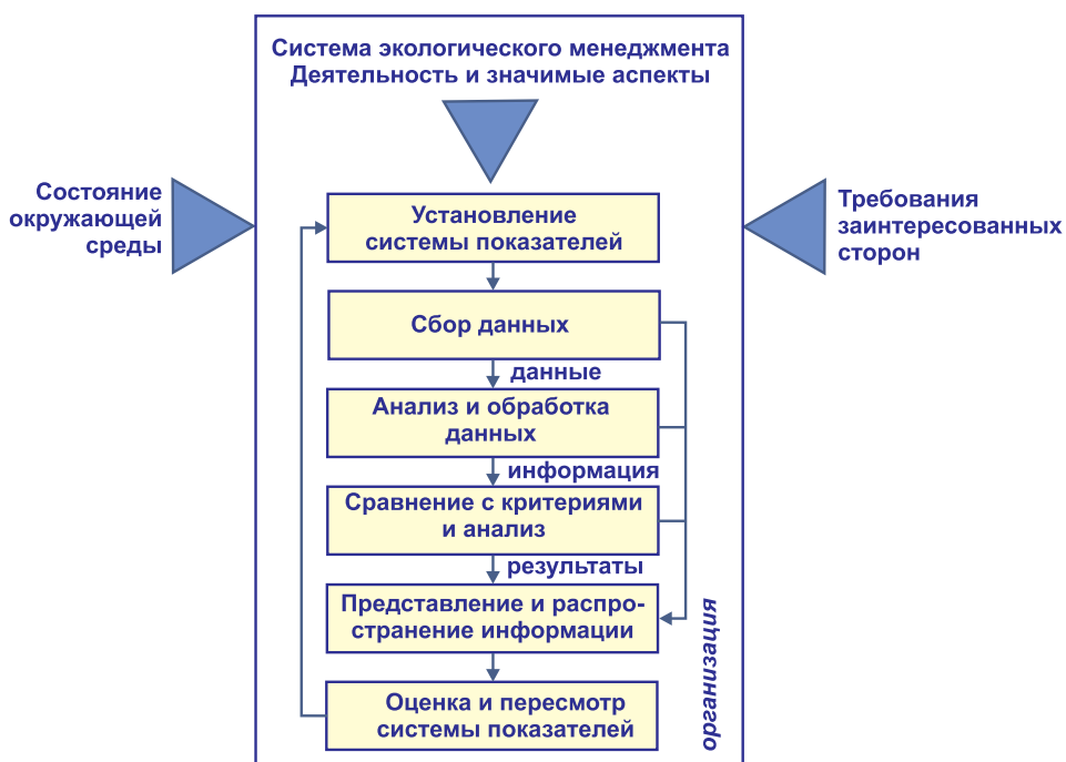
Рис. 1. Оценка экологической результативности (эффективности) предприятия [9]

В системе экологического менеджмента и стандартах ISO серии 14000 прописано, что для выделения значимых экологических аспектов организация должна разработать прозрачные критерии значимости экологических аспектов , которые включают помимо требований выполнения законодательства и нормативных актов информацию о состоянии окружающей среды, существующие данные организации о входных потоках вещества и энергии, сбросах, выбросах и отходах в терминах риска, мнения заинтересованных сторон, природоохранную деятельность организации и др. (рис. 1) [9]. При этом должна быть учтена не только основная, но и вспомогательная деятельность [3, 5, 9].