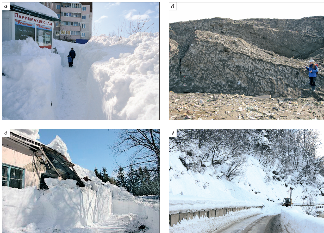
Рис. 1. Опасные процессы и явления, связанные со снегом, на о. Сахалин.

a – улицы г. Южно-Сахалинска после метели 02.03.2013 г.; б – снежный полигон в г. Южно-Сахалинск, 27.05.2009 г.; в – обрушение крыши школы в с. Пятиречье, 2009 г.; z – расчистка от лавинного завала автомобильной дороги Южно-Сахалинск–Невельск, 05.02.2014 г.