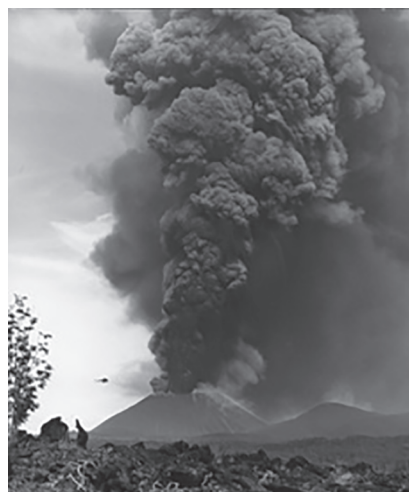
Рис. 2. Извержение вулкана Толбачик, Камчатка, 1976 г.

шлаковых или пирокластических куполов в несколько сотен метров в поперечнике и 100–200 м высотой, нередко содержащих мантийные ксенолиты (рис. 1).