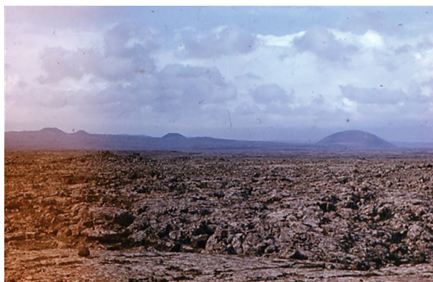
Рис. 1. Четвертичное базальтовое плато Харрат-Аш-Самах (Harrat Ash Shamah) с пирокластическими и шлаковыми куполами на поверхности. Юго-западная Сирия, возвышенность Джебель-Друз.