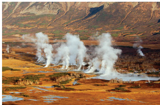
Рис. 5. Кальдера Узон на Камчатке.

В результате опустошения очага обычно возникает просадочная депрессия (кальдера), и вулкан безопасен вплоть до возникновения нового очага в результате возобновления подтока водонасыщенного расплава, после чего все может снова повториться. Однако чаще всего этого не