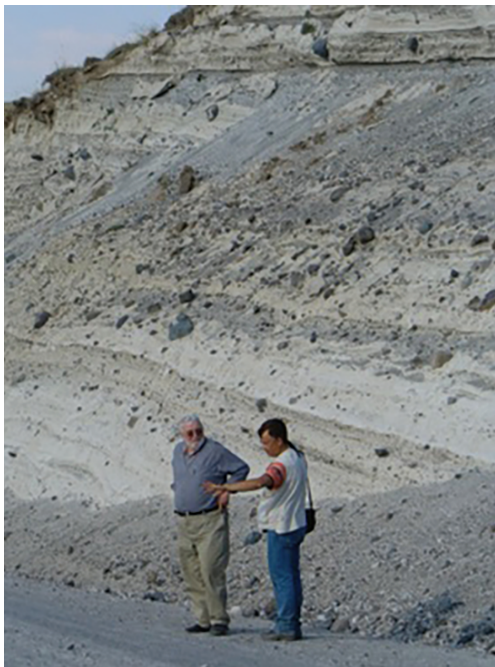
Рис. 4. Кальдера вулкана Немрут, образованная переслаиванием туфов дацит-риолитового состава; слоистость туфов свидетельствует о множестве взрывов при формировании кальдеры. Восточная Анатолия, Турция. Турецкий вулканолог М. Кескин (M. Keskin) демонстрирует автору ситуацию.

бинах (2–5 км, часто прослеживаясь до глубин 5–16 км, при радиусе 4–13 км) [Макдональд, 1975; Злобин и др., 1997; Гурбанов и др., 2008; Федотов и др., 2010; Лемзиков, 2014; Chen et al., 2018; Zellmer et al., 2019; и др.], так что эта предпосылка в природе реализуется.