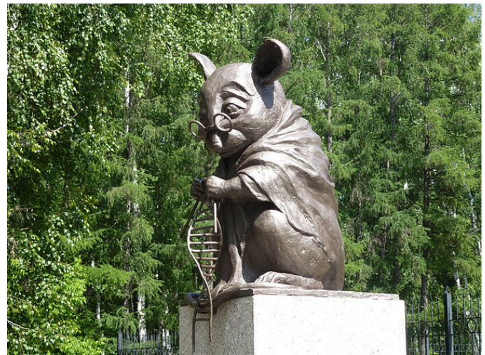
Памятник мыши, вяжущей нить ДНК в Академгородке г. Новосибирска.

С другой стороны, найдено и немало различий, которые могут ограничивать использование грызунов в качестве лабораторных моделей человеческого организма. Это касается множества генов, вовлеченных в работу иммунитета, метаболизм и развитие стрессовых реакций. Описывая картину в целом, можно сказать, что мы разделяем с мышами