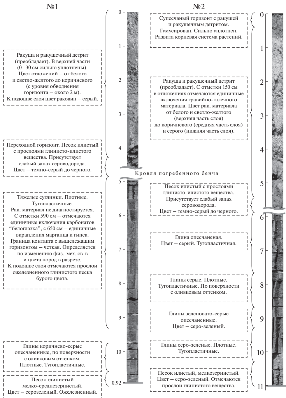
Рис. 1. Характеристика скважин № 1 и 2 с косы Долгая (Ейский район, Краснодарский край).

В период 2–7 августа 2019 г. проведено бурение и изучение выходов геологических отложений в естественных обнажениях (карьерах) на косе Долгой (рис. 1). При бурении скважин использовалась малогабаритная буровая установка на базе автомобильного прицепа “TRAILER-20”. Колонковое бурение проводилось вращательным методом без промывки скважины водой. Пробы отбирались с выделенных литологических горизонтов. Конкретная привязка к формам рельефа