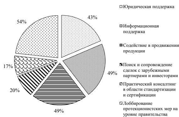
Рис. 4. Необходимые формы практической помощи предприятиям в условиях вступления России в ВТО, %

В комментариях к вопросу о формах поддержки преобладали следующие предложения мер такой поддержки: