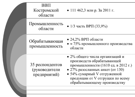
Рис. 1. Объект анкетирования и его место в экономике Костромской области

аналогичного показателя по всему обрабатывающему производству Костромской области;