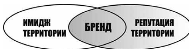
Рис. 1. Имидж, бренд и репутация территории