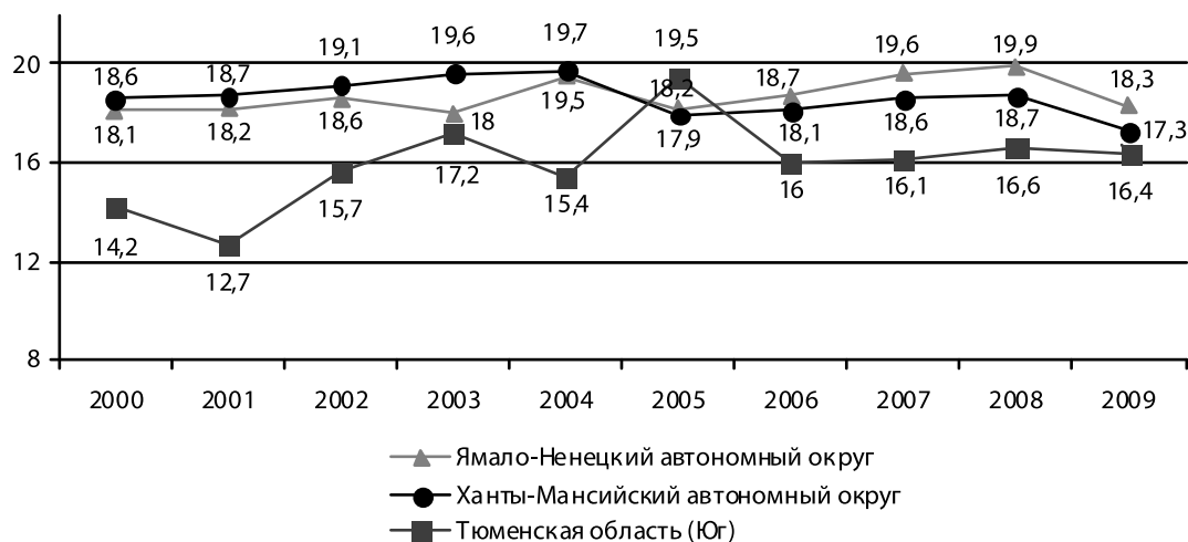
Рис. 3. Коэффициент фондов в регионах Тюменской области в 2000–2009 гг., раз

распределение доходов было характерно для всех регионов области (рис. 2). Таким образом, несмотря на то что в материальной дифференциации общества наблюдаются процессы восходящей мобильности, они не носят всеобщего характера, локализуясь преимущественно в средних доходных группах населения. Верхняя же группа по-прежнему концентрирует значительную долю общественного богатства, сохраняя разрыв между собой и другими социальными слоями.