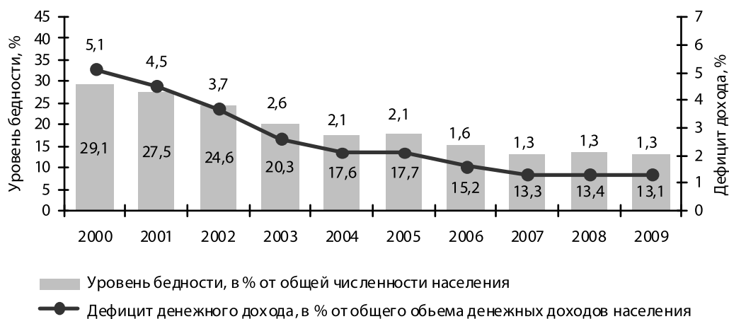
Рис. 1. Динамика уровня и глубины бедности в РФ на основе макроэкономических данных, %

государственной и региональной систем социальной защиты, способствующей снижению численности бедного населения, смягчению социальной дифференциации, созданию среднего класса как основы стабильности и процветания страны. При этом центральной проблемой социально-экономической политики является проблема неравенства в доходах. Высокий уровень имущественного неравенства ведет к деградации значительной части населения, гасит импульсы экономического развития, создает очаги напряжения в обществе и препятствует социальному прогрессу.