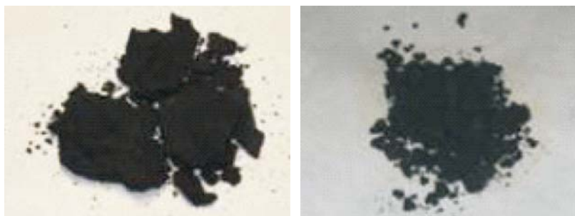
Рис. 2. Сульфиды металлов, преимущественно железа, взятые из АВО Fig. 2. Sulfides of metals, mainly iron, taken from АСНЕ

Образцы, взятые на одном из НПЗ, расположенных в Самарской области, исследовали рентгеновским флуоресцентным спектральным методом (РФА) на спектрометре "Спектроскан МАКС — GV", методом химического анализа (количественный и качественный), методом экстракции, ИК-спектральным методом. Основные результаты анализа представлены в табл. 1, 2.