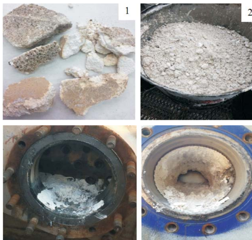
Рис. 1. Образцы отложений:

Рабочей гипотезой исследований выступает возможность обеспечения утилизации серо- и формальдегидсодержащих шламов нефтяного комплекса в качестве биоингибиторов разложения ТКО в условиях полигонов с минимальным экологическим