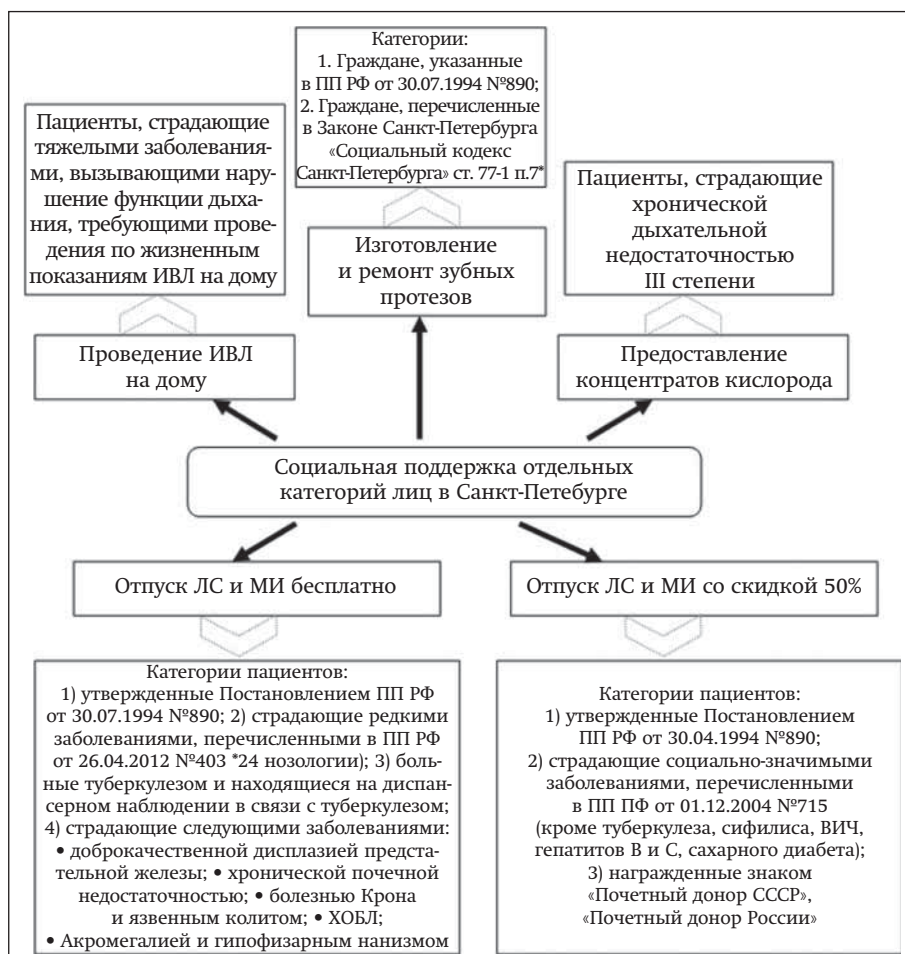
Рис. 1. Организация социальной поддержки отдельных категорий граждан в Санкт-Петербурге ИВЛ – искусственная вентиляция легких; ПП РФ – Постановление Правительства Российской Федерации; ЛС и МИ – лекарственные средства и медицинские изделия; ХОБЛ – хроническая обструктивная болезнь легких. * Категории граждан: 1) Граждане, являющиеся получателями ежемесячной или ежегодной денежной выплаты, а также ежемесячных пожизненных компенсационных выплат и имеющих доход на 1 человека в семье ниже двукратного размера величины прожиточного минимума в расчете на душу населения, установленного в Санкт-Петербурге за квартал, предшествующий месяцу обращения; 2) дети до достижения возраста 18 лет Fig. 1. Organization of social support for certain categories of citizens in Saint Petersburg

Анализ объема расходов на проведение мероприятий в рамках государственной программы по здравоохранению в Санкт-Петербурге, включающей аспекты медицинской и фармацевтической помощи населению города, а также обеспечение лекарственными препаратами льготных категорий граждан, позволяет прийти к заключению об увеличении расходов на реализацию программы, превышающих ежегодный уровень инфляции. Так, в 2016 г. прирост объема бюджетных ассигнований составил около 8% при значении индекса инфляции 5,4%, в 2017 г. – 18% при инфляции в 2,5% (см. рис. 2).