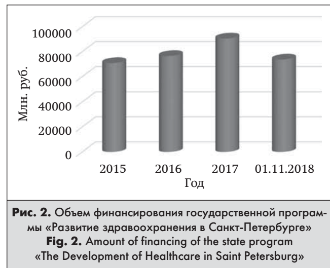
Рис. 2. Объем финансирования государственной программы «Развитие здравоохранения в Санкт-Петербурге» Fig. 2. Amount of financing of the state program «The Development of Healthcare in Saint Petersburg»

Анализ структуры расходов по статьям бюджета Санкт-Петербурга, которые включают в себя лекарственное обеспечение граждан города, показал, что значительная часть затрат относится к бюджету субъекта РФ. За исследуемый период наблюдения отмечена тенденция к росту объема финансирования бюджета Санкт-Петербурга: в 2016 г. показатель увеличился на 19% в сравнении с предыдущим годом, в 2017 г. – на 11%. При этом величина федеральных ассигнований имеет противоположный характер: в 2016 г. регресс составил