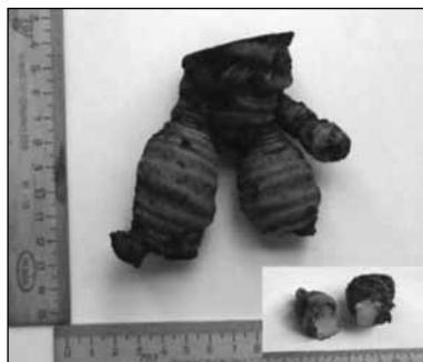
Рис. 1. Внешний вид цельных корневищ ириса болотного Fig. 1. Appearance of yellow iris rhizomes

При рассмотрении микропрепаратов измельченного сырья и порошка корневищ ириса болотного под микроскопом видны: фрагменты одревесневшего эпидермиса, состоящего из четырех-, пятиугольных клеток с прямыми утолщенными стенками; группы паренхимных клеток с мелки-