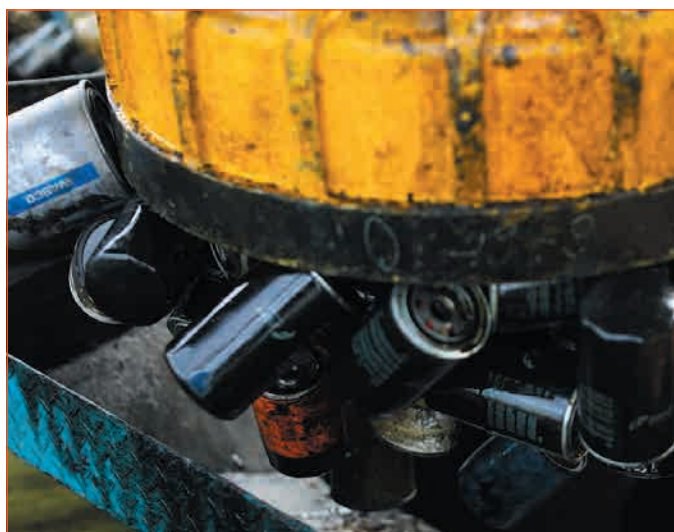
Фото 2. Прессование масляных фильтров