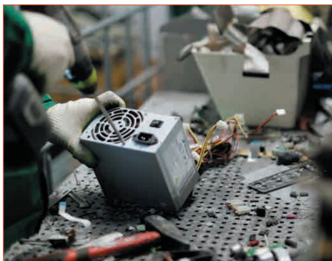
Фото 3. Ручная разборка ОЭЭО