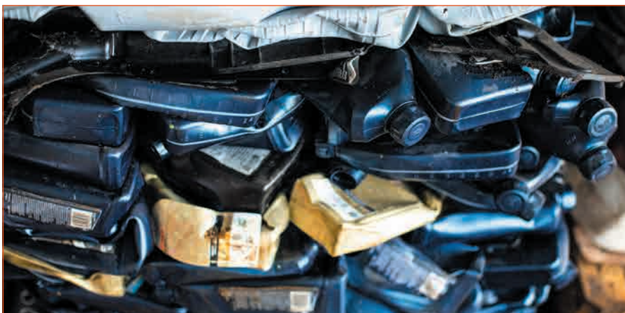
Фото 5. Один из видов пластиковых отходов, принимаемых на переработку

Например, переработка отслужившей свой век корпусной мебели. Трудно поверить, но на территории Московского региона никто ее не перерабатывает, и вся старая древесно-стружечная продукция сотнями тонн идет на полигоны. А ведь из