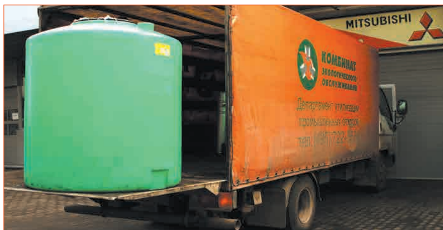
Фото 1. Вывоз отработанных масел с обслуживаемого предприятия

Итак, речь идет о старейшем в России экотехнопарке: он развивается уже 15 лет. Рассмотрим, как построена его работа. АО «Комбинат экологического обслуживания» (далее – Комбинат) всегда и во всем руководствуется принципами комплексности, поэтому обращение с отходами своих контрагентов он начинает далеко от собственной площадки. На обслуживаемых предприятиях осуществляется установка контейнеров, соответствующих принимаемым видам отходов, и дальнейший вывоз отходов (фото 1). В составе Комбината имеется подразделение по разработке разрешительной документации и оформлению отчетности, деятельность которого в числе прочего обеспечивает формирование инфраструктуры отдельного сбора промышленных отходов на предприятиях: либо