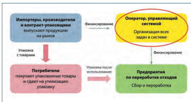
Рис. 1. Схема организации системы РОП