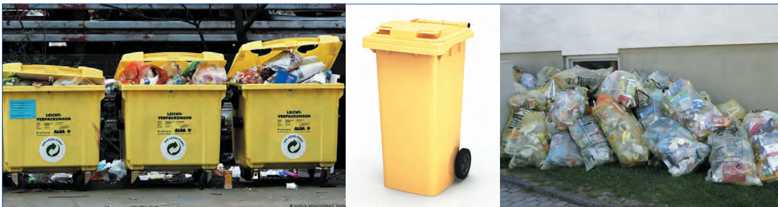
Фото 1. Варианты накопления легкой упаковки