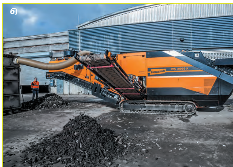
Рис. 3. Сепараторы: а) водный; б) воздушный

Компания Doppstadt предлагает следующие виды оборудования – как мобильного, так и стационарного исполнения.