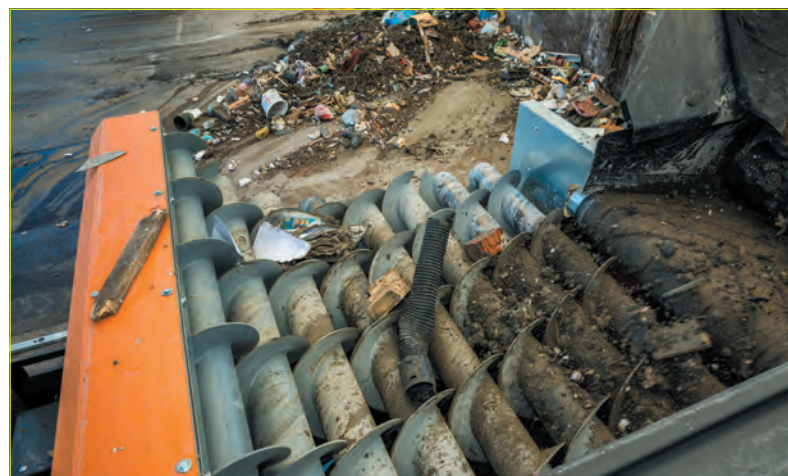
Рис. 1. Шредеры и дробилки Doppstadt