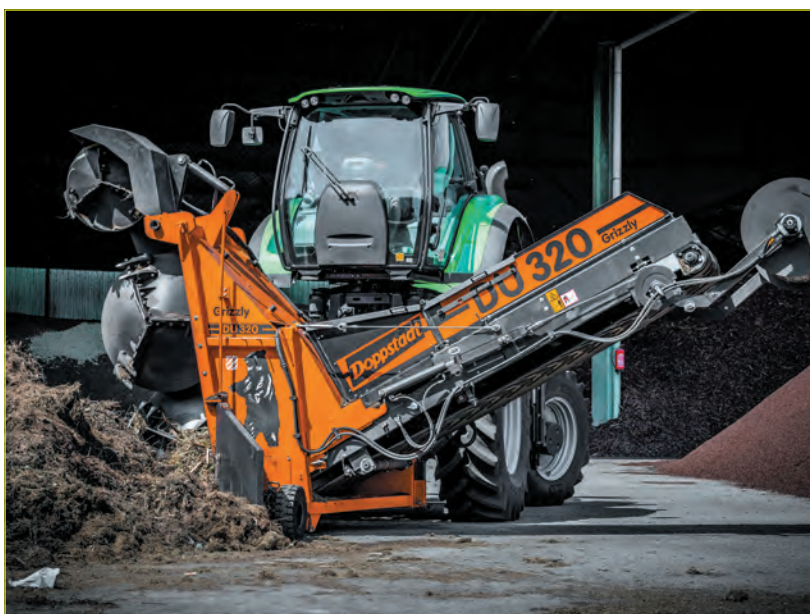
Рис. 4. Навесной ворошитель Doppstadt

Компания Doppstadt совместно с ООО ТПК «НТЦ» предлагает комплексные решения даже самых сложных задач по переработке и утилизации отходов. Оборудование Doppstadt – гарант надежности и высокого качества. ♻️