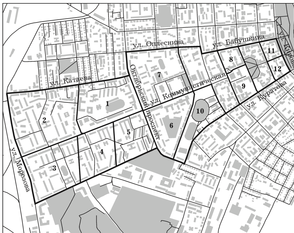
Рис. 1. Карта-схема района исследования. Цифрами 1–12 обозначены номера учетных участков

Для описания биоповреждений на каждом участке проводили осмотр древесно-кустарниковой растительности, отбирали по 10 ли-