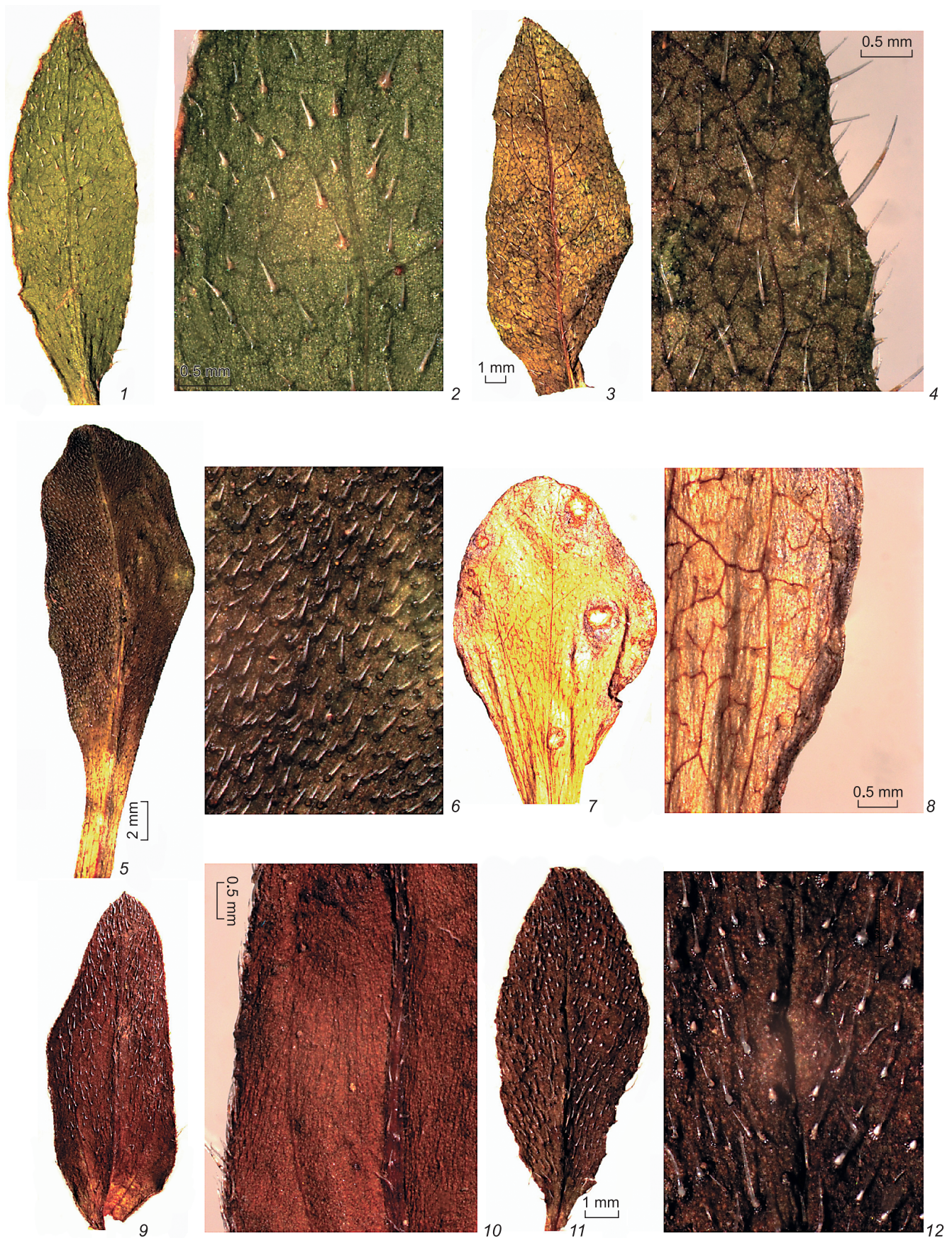
Рис. 2. Форма и опушение прилистников у видов рода Anoplocaryum и представителей родов Microula и Bothriospermum : 1, 2 – A. compressum ; 3, 4 – A. helenaе ; 5, 6 – A. turczaninowii ; 7, 8 – A. tenellum ; 9, 10 – Microula sikkimensis ; 11, 12 – Bothriospermum zeylanicum .

1, 2, 5–9, 11, 12 – верхняя сторона прилистника; 3, 4, 10 – нижняя сторона прилистника. Масштабная линейка: 3, 5, 7 – 2 мм; 1, 9, 11 – 1 мм; 2, 4, 6, 8, 10, 12 – 0.5 мм.