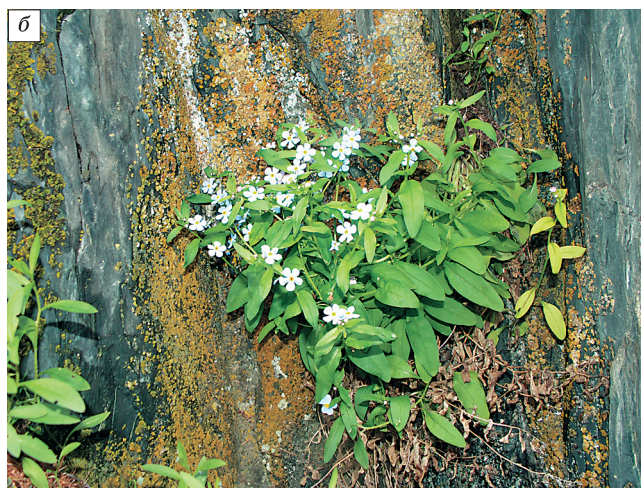
Рис. 4. Фотографии растений в природе:

а – A. compressum (Забайкальский край: Ононский р-н, 5 км ЮВ с. Лаха, окр. Цаган-Обо, Адун-Челонский горный массив, под скалами, 02.08.2009, А.Ю. Корольюк); б – A. turczaninowii (Республика Тыва, Бай-Тайгинский р-н, окр. пос. Кара-Холь, плато Алаш, тенистые скалы, 24.06.2006, Д.Н. Шауло).