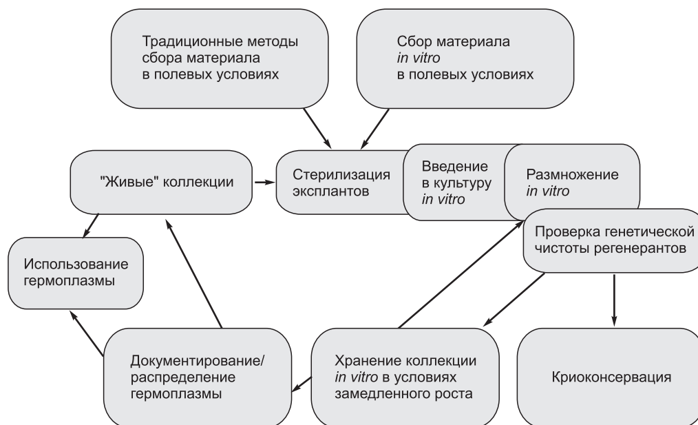
Рис. 2. Включение технологий in vitro в сохранение биоразнообразия ex situ (по L.A. Withers, 1995, с модификациями).

ала in vitro может быть менее инвазивным, чем изъятие целых растений из природных местообитаний. Кроме того, этот прием является эффективным для сбора большого количества образцов, когда семена или не созрели на момент экспедиции, или имеют нарушения в развитии (Reed et al., 2011). В теории, благодаря тотипотентности растительных клеток, почти все клетки растений способны дать начало целому ор-