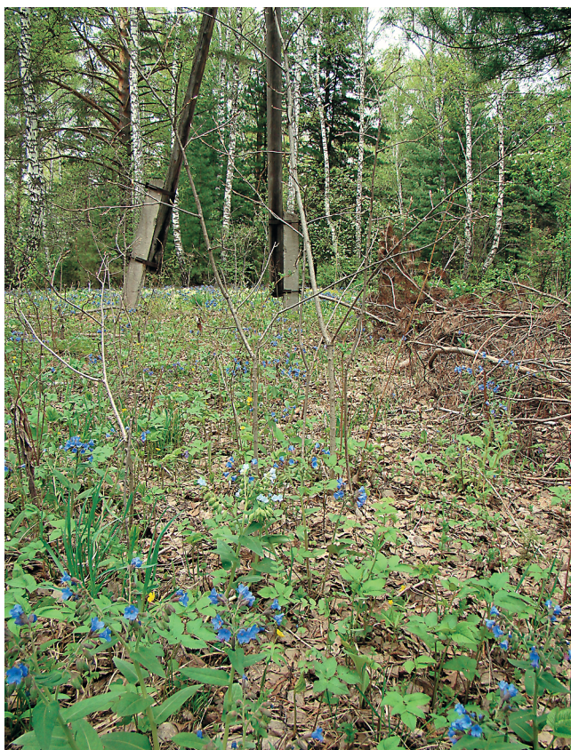
Рис. 4. Ценопопуляция P. mollis под ЛЭП, окр. с. Заварзино (в центре – белоцветковая форма).