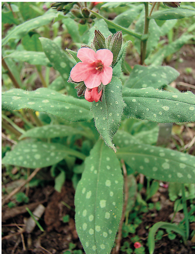
Рис. 1. P. saccharata – декоративно-лиственное растение.