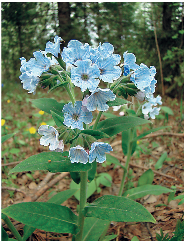
Рис. 3. P. mollis , окр. с. Заварзино, Томская область.