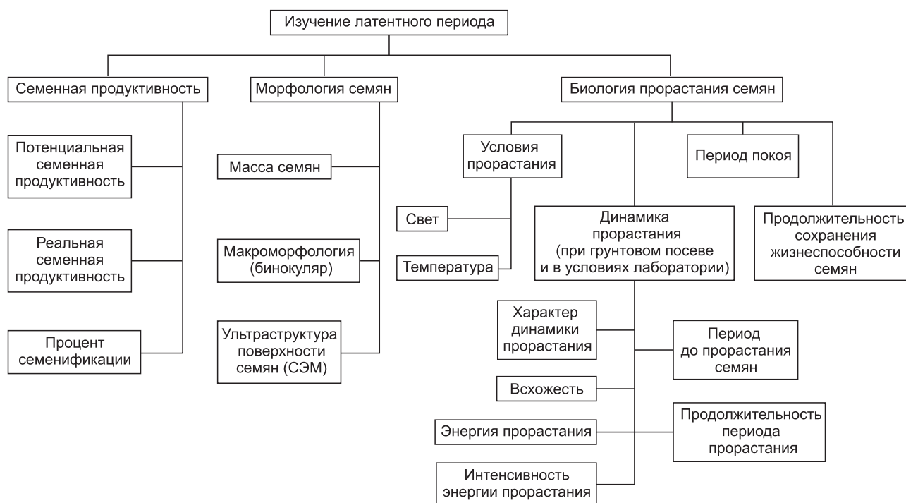
Рис. 1. Схема исследования латентного периода.