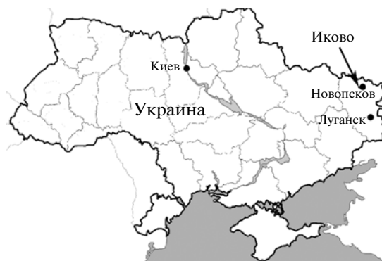
Рис. 1. Географическое положение местонахождения позвоночных Иково (средний эоцен, ранний лютет).

зная часть зубной кости оканчивается на уровне альвеолы седьмого зуба (d7). Симфизная поверхность шероховатая, с множеством узких продольных островершинных гребней и борозд между ними. Наибольшей ширины симфизная часть зубной кости достигает на уровне альвеол шестого–седьмого зубов (d6–d7), постепенно сужаясь в переднем направлении. Высота симфизной части зубной кости примерно одинаковая в промежутке от уровня альвеолы третьего зуба (d3) до уровня альвеолы седьмого зуба (d7). Форма и размеры альвеол различаются между собой: альвеолы для третьего (d3), пятого, шестого и седьмого зубов (d5–d7) круглые, практически одинакового размера; альвеола для четвертого зуба (d4) круглая, заметно крупнее остальных; альвеола для второго зуба (d2) овальной формы, удлинена в передне-заднем направлении (рис. 3). Начиная с альвеолы третьего зуба (d3) и до альвеолы первого зуба (d1) увеличивается наклон альвеолярных полостей в переднем направлении. Высота альвеолярных валов третьего, пятого, шестого и седьмого зубов (d3, d5, d6, d7) почти одина-