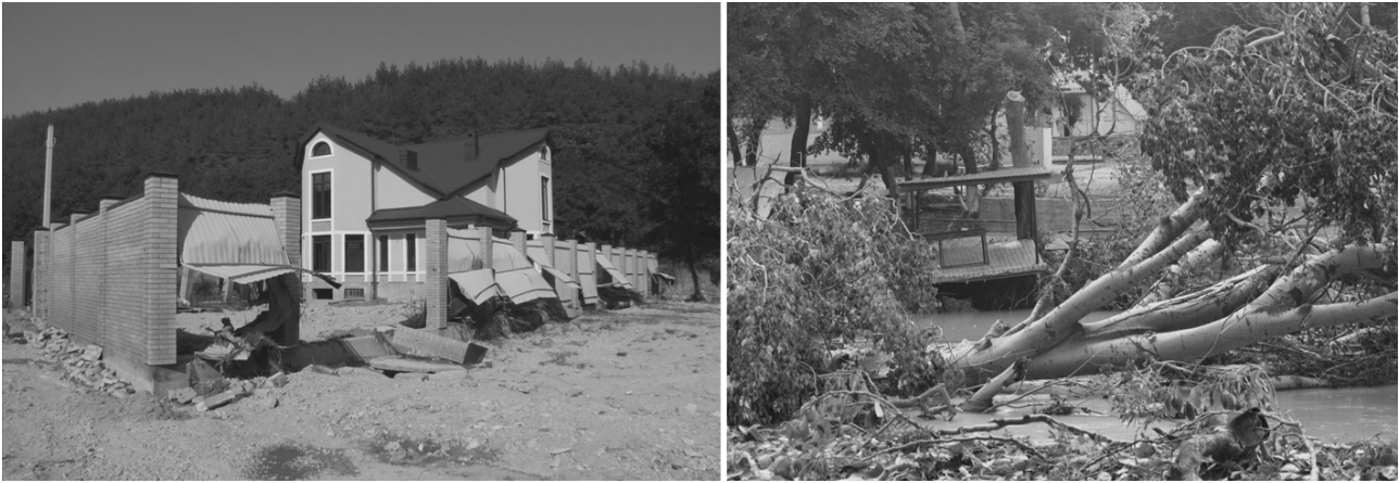
Рис. 4. Следы прохождения паводка 06.07.2012 г. в долине р. Ашамба.