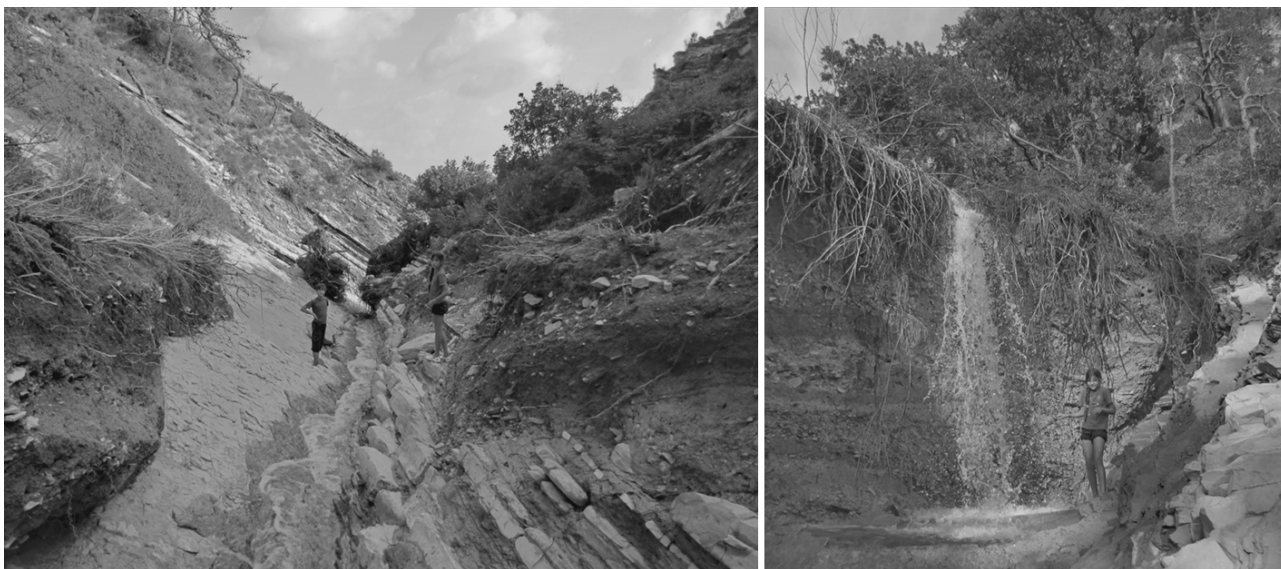
Рис. 3. В нижней части Первой щели делювий полностью смыт до скального основания (слева), образовался уступ более 3 м высотой (справа).

участках долин с v-образным поперечным профилем произошел размыв делювия до скального основания, образовались уступы высотой до 3 м (рис. 3). Там, где долины имеют корытообразное