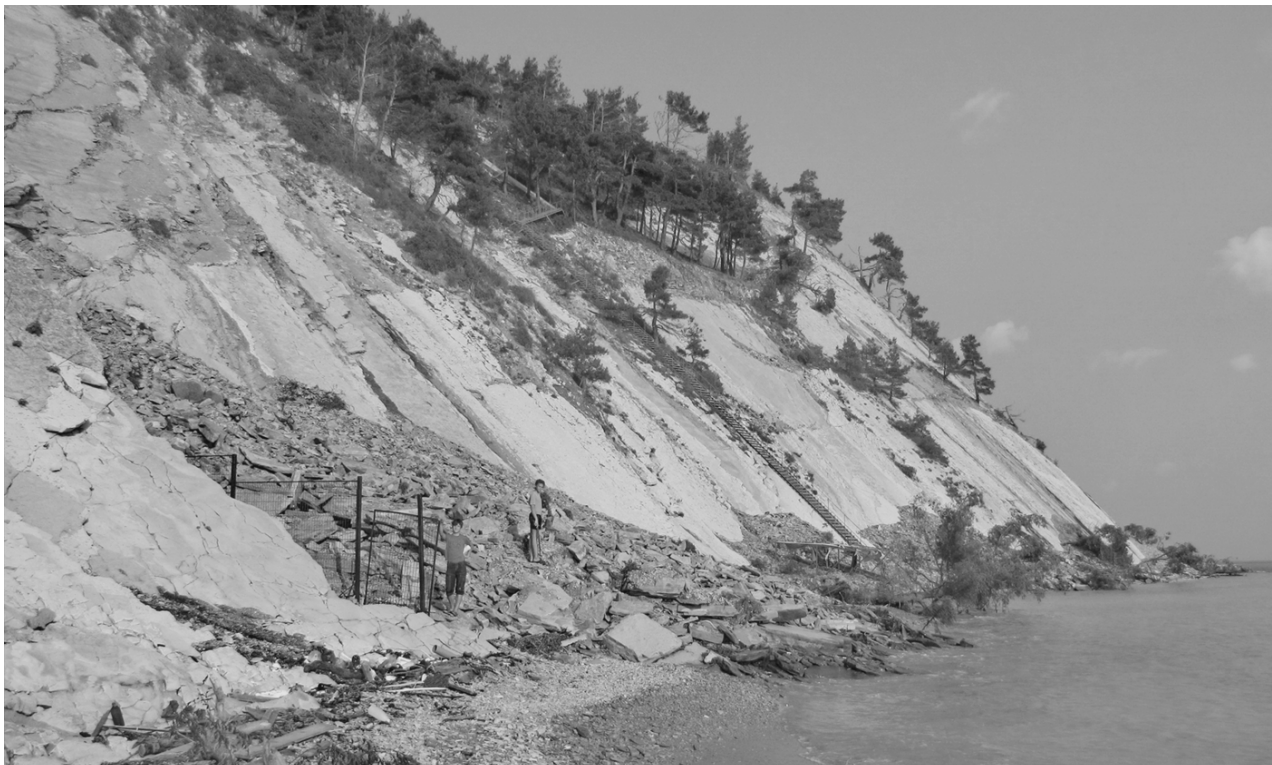
Рис. 2. В результате интенсивного ливня на клифе произошло обрушение ослабленных выветриванием пластов флиша вместе с расположенными на них пицундскими соснами.