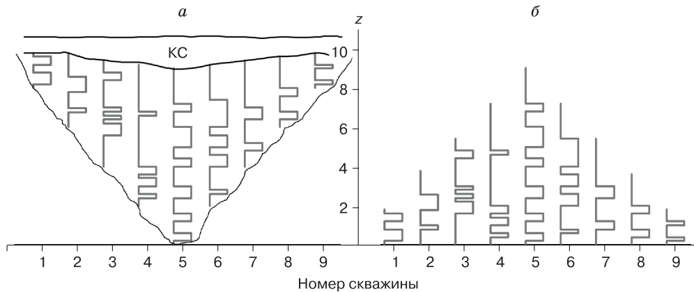
Рис. 1. Распределения пористости неконсолидированной части киля тороса в отдельных скважинах (а) и при сдвиге до горизонта максимальной осадки киля (б).

КС – консолидированный слой; z – расстояние от нижнего края киля.