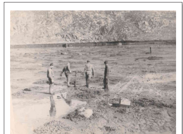
Рис. 3. Осушка на Мурманском побережье. Во время отлива бригада переносит якоря

Ранее 23-й ГМППИ уже имел опыт бурения скважин со льда приливных морей. Основная особенность замерзшего приливного моря заключается в том, что лед постоянно перемещается не только в вертикальной плоскости вместе с приливами и отливами, но и в горизонтальном направлении. Поэтому перед началом монтажа бурового станка в толще льда прорубают узкую длинную майну (прорубь). Устье скважины располагается у того края майны, в сторону которого происходит горизонтальное движение льда. Обычно оно идет в направлении от берега в сторону моря. Если при горизонтальном перемещении льда буровая установка смещается с устья скважины, ее немедленно передвигают на место. Случалось, что буровая бригада приходила на скважину после перерыва в работе и не находила ее. Скважину накрывал лед.