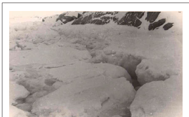
Рис. 4. Взлом льда в зоне осушки во время отлива