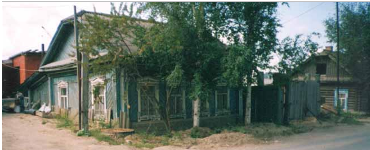
Фото 3. Ханты-Мансийск, ул. Сирина дом, 52 — здесь в 1970–1980-х годах базировалась Тюменская экспедиция геологического факультета МГУ