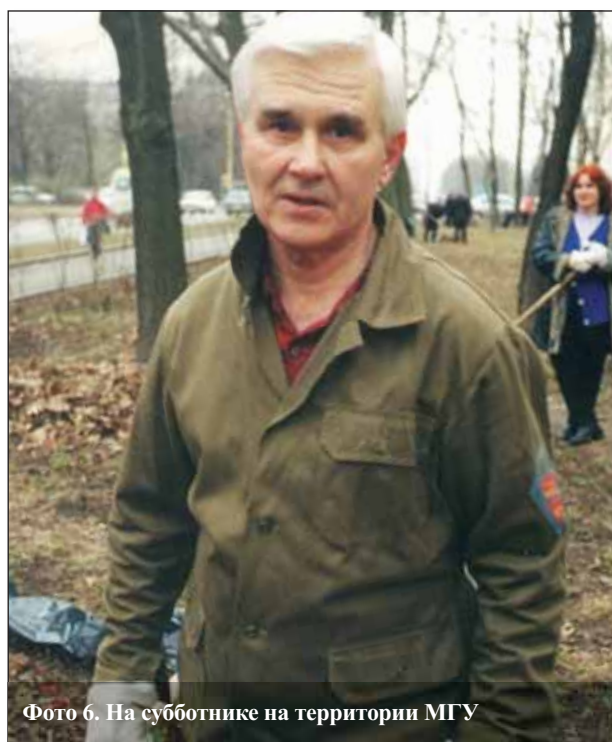
Фото 6. На субботнике на территории МГУ