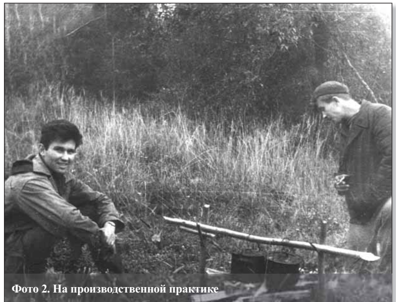
Фото 2. На производственной практике