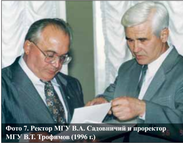
Фото 7. Ректор МГУ В.А. Садовничий и проректор МГУ В.Т. Трофимов (1996 г.)

лаборанта (1960–1963) и ассистента (1963–1969) до профессора (с 1978 г.) и заведующего кафедрой (с 1989 г.). В 1964 году защитил кандидатскую, а в 1976-м — докторскую диссертацию на тему «Инженерно-геологическое районирование крупных территорий на основе анализа закономерностей пространственной изменчивости инженерно-геологических условий». В 1987–1992 годах он — декан геологического факультета МГУ, а с 1992 года — проректор Московского университета.