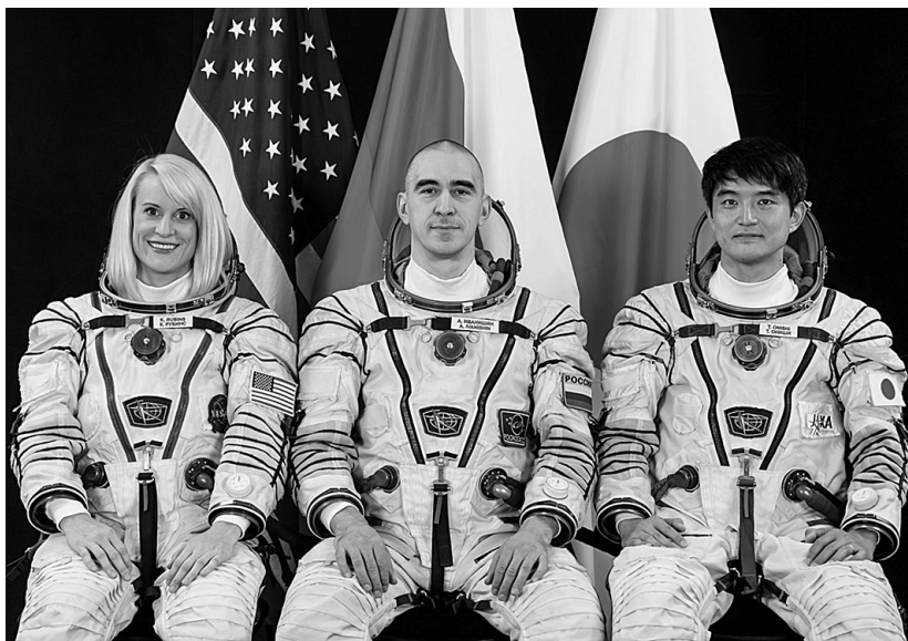
Экипаж нового КК “Союз МС-01” и 48-й основной экспедиции на МКС: К. Рубинс (США), А.А. Иванишин (Россия) и Т. Ониси (Япония).

Анатолий Алексеевич Иванишин (522-й астронавт мира, 112-й космонавт России) родился 15 января 1969 г. в Иркутске. В 1987 г. со второй попытки поступил в Черниговское высшее военное авиационное училище летчиков и в 1991 г. окончил его с золотой медалью. В 1991–2003 гг. проходил службу в строевых частях ВВС. Военный летчик 3-го класса, инструктор парашютно-десантной подготовки, гвардии полковник авиации. В 2003 г. окончил Московский государственный университет экономики. В 2003 г. зачислен в отряд космонавтов ЦПК им. Ю.А. Гагарина, проходил подготовку в нескольких экипажах МКС. Совершил космический полет в ноябре 2011 г. – апреле 2012 г. продолжительностью 165 сут 07 ч на КК “Союз ТМА-22”