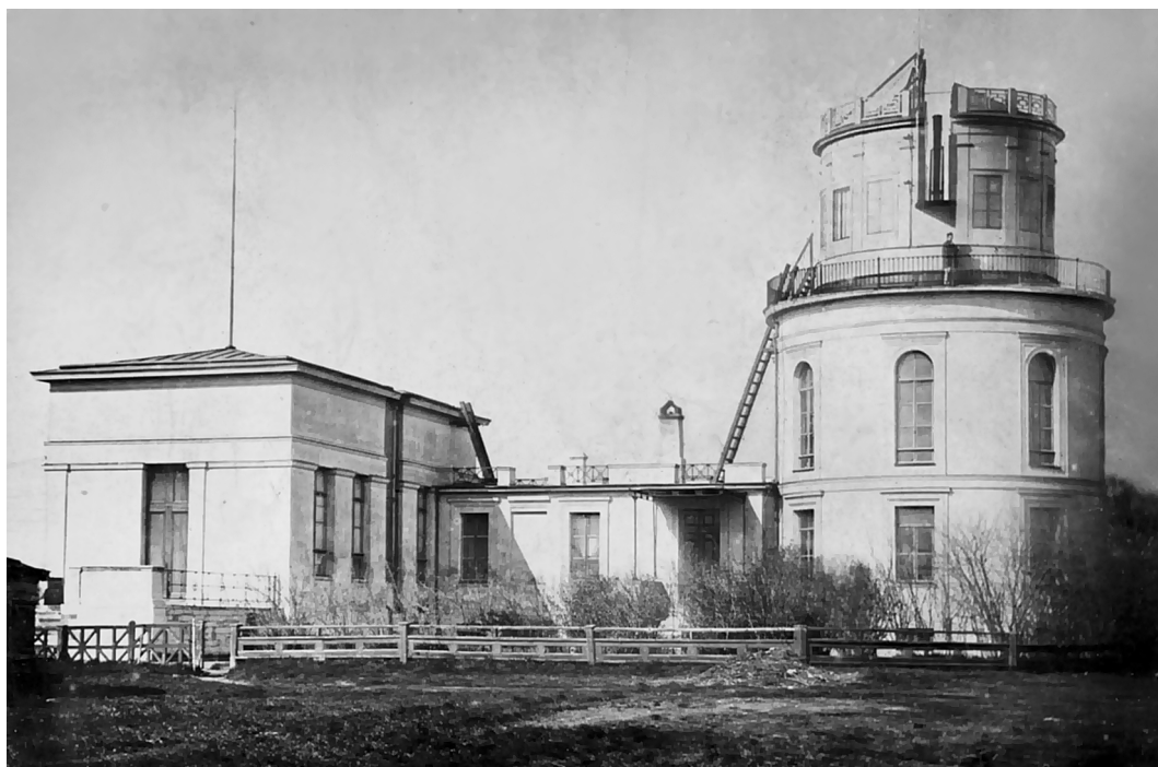
Астрономическая обсерватория Московского университета после реконструкции, 1840–1850-е гг. Фото, выполненное Б.Я. Швейцером в 1864 г.

Важно отметить, что, привлекая к реконструкции обсерватории молодых сотрудников, Богдан Яковлевич поло-