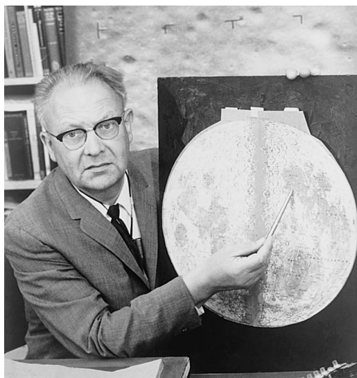
Дж. Койпер в Лунно-планетной лаборатории Аризонского университета. Начало 1960-х гг.

эволюцию Луны и историю ее поверхности стал близок к современной планетной космогонии. Именно Койпер по снимкам Луны детально изучил последовательность ударного образования лунных морей, поэтапное расплавление оболочки Луны с выходом базальтовых лав на поверхность в ударных впадинах.