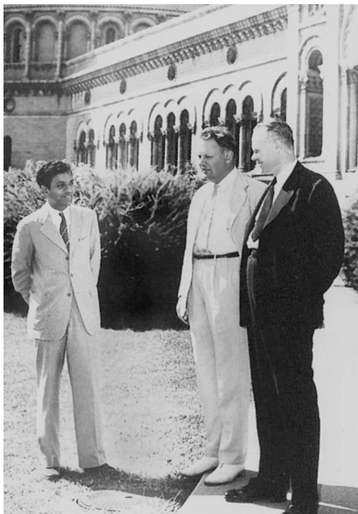
С. Чандрасекар, Дж. Койпер и О.В. Струве в Обсерватории Макдональд (штат Техас). 1939 г.

По всей видимости, Койпер задумывался об исследованиях планет еще в Лейдене, когда возникал вопрос о теории образования Солнечной системы. Несмотря на это, его первые изыскания были посвящены звездной астрофизике. Еще работая на Ликской обсерватории, Койпер занимался изучением физики двойных звезд – это тема его диссертации. Он пришел к выводу, что у двойных звезд экстремально короткие периоды вращения и они расположены близко друг к другу. Наблюдая на крупнейших телескопах – 36-дюймовом рефракторе и 36-дюймовом крослеевском рефлекторе Ликской обсерватории, а затем на 40-дюймовом рефракторе Кларка Йеркской обсерватории, – Койпер открыл множество новых двойных систем и 21 белый карлик. Особенно значительным его научным результатом этого периода стал вывод, сделанный и опубликованный в 1938 г., о существенной роли двойных систем в Галактике. По оценке Койпера, не менее 50% ближайших к нам звезд – двойные или кратные. Описывая двойную систему \beta Лиры, ученый ввел термин “контактные двойные звезды” и предсказал, что вещество, оторвавшееся от большей звезды, должно образовывать кольцо вокруг меньшей звезды-компонента. Аккреционные диски, образовавшиеся при перетекании веществ в тесных двойных системах, к концу XX в. стали важным объектом исследования астрофизиков. Он углубил смысл главной последовательности на диаграмме спектр – светимость Герцшпрунга – Рассела, уточнив для звезд этой последова-