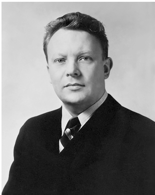
Директор Йеркской обсерватории Чикагского университета Дж. Койпер. 1947 г.

ектам подогревался исследованиями С. Чандрасекара, изучавшего природу вырожденного вещества для выбора теории производства энергии внутри звезд.