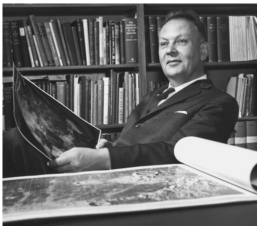
Дж. Койпер с атласом Луны. Конец 1960-х гг.

В 1960-е гг. произошло разветвление американской астрономии на два направления – лунно-планетное и звездно-галактическое. В этот период Койпер занимался ранней эволюцией Луны, изучил проблему ударного происхождения лунных морей. Под его руководством выполнены важнейшие исследования Луны и планет Солнечной системы с помощью АМС по программам "Рейнджер", "Лунар Орбитер" и "Сервейер". В 1964–1965 гг. американские станции "Рейнджер-7–9" перед падением на Луну передали на Землю четкие фотографии лунной поверхности с самыми мелкими деталями (Земля и Вселенная, 1966, № 6). Это позволило выбрать места посадок для АМС серии "Сервейер", которые в 1966–1968 гг. осуществили мягкие посадки на лунную поверхность, исследовали