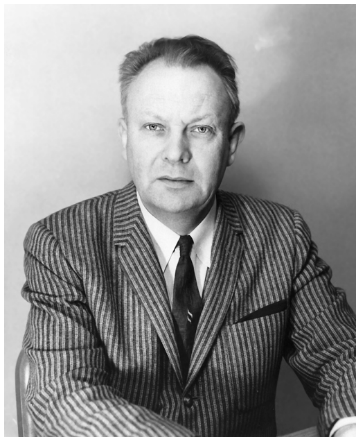
Руководитель Обсерватории Макдональд Дж. Койпер. 1950-е гг.

К концу 1940-х гг. Койпер пришел к выводу, что значительного прогрес-