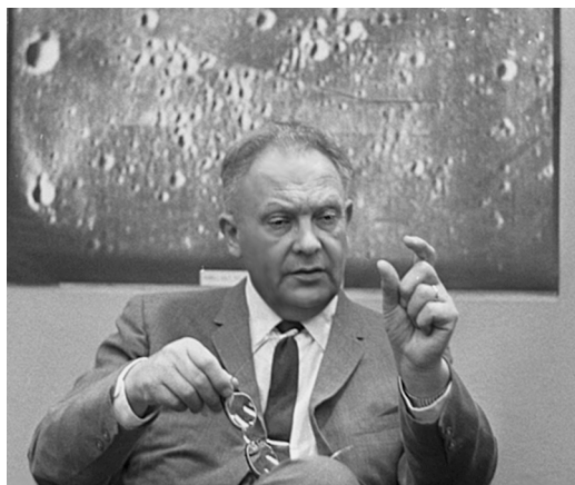
Дж. Койпер комментирует полученные АМС “Рейнджер-9” снимки Луны. Апрель 1965 г.

В конце 1960 г. Дж. Койпер еще раз приехал в СССР на симпозиум МАС “Луна”, посвященный первым снимкам лунной поверхности, полученным АМС “Луна-3” (Земля и Вселенная, 1999, № 6; 2009, № 4). Он выступил с весьма дружественной речью, обращенной к советским участникам. Его взгляд на