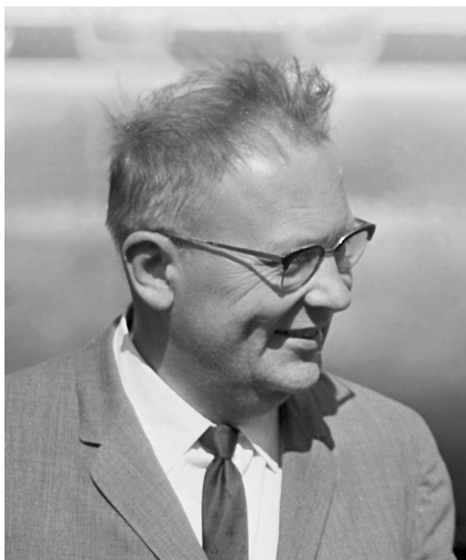
Дж. Койпер. 1964 г.

Выдающийся американский астроном Джерард Койпер (Gerard Peter Kuiper) – один из самых влиятельных астрономов середины XX в., он внес значительный вклад в изучение двойных звезд и Солнечной системы. Дж. Койпер открыл атмосферу на спутнике Сатурна Титане, исследовал свойства атмосфер Марса и внешних планет; разработал космогоническую модель, в которой предсказывалась возможность существования малых тел за пределами Солнечной систе-