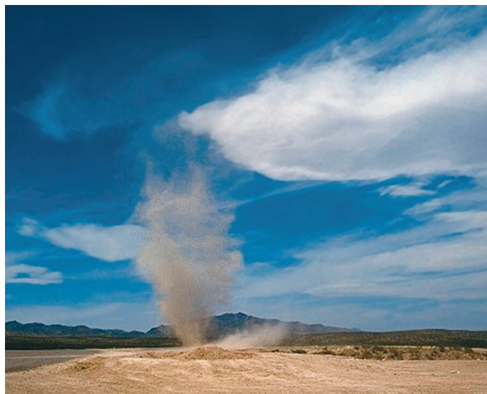
Пылевой дьявол в Новой Зеландии.

Наряду с пылевыми дьяволами в море или на озерах наблюдаются водяные дьяволы аналогичного происхождения. При этом вместо пыли смерчи увлекают капли воды. Кроме того, во время пожара при полном штиле неожиданно