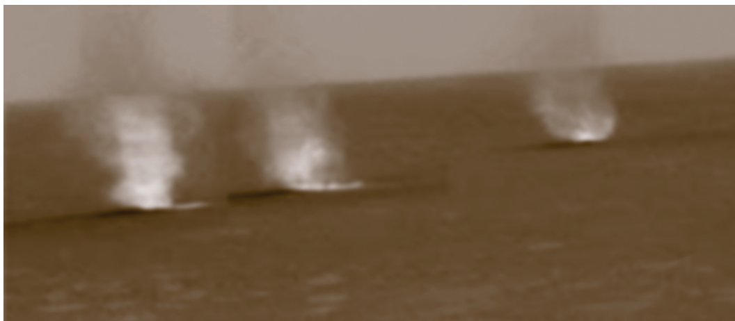
Пылевые вихри на Марсе. Снимок получен в мае 2005 г. марсоходом "Спирит".

наблюдаются загадочные огненные дьяволы. Сами по себе они не несут опасности, но в сочетании с другими природными или окружающими их факторами способны привести к беде. Так, в 1923 г. огненный вихрь, образовавшийся во время Великого землетрясения Канто в Японии, погубил 38 тыс. человек всего за 15 мин.