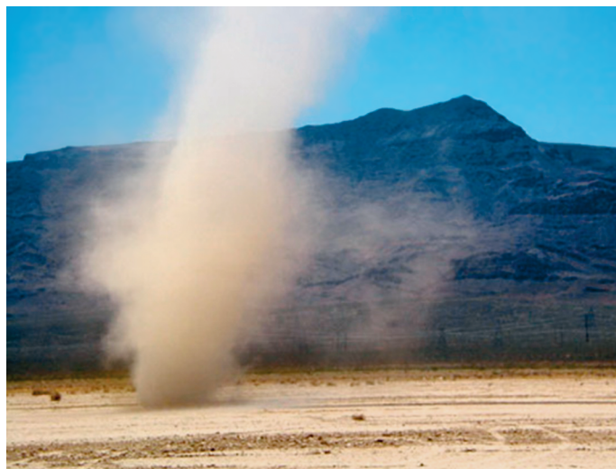
Пылевой смерч в Долине Эльдорадо (штат Невада, США).

Так и будут бродить до скончания веков, Каждый час все грозней и грознее, Головой пропадаю среди облаков, Эти страшные серые змеи. Но мгновенье... отстанет и дрогнет одна И осядет песчаная гряда, Это значит – в пути спотыкнулась она О ревущего в страхе верблюда.