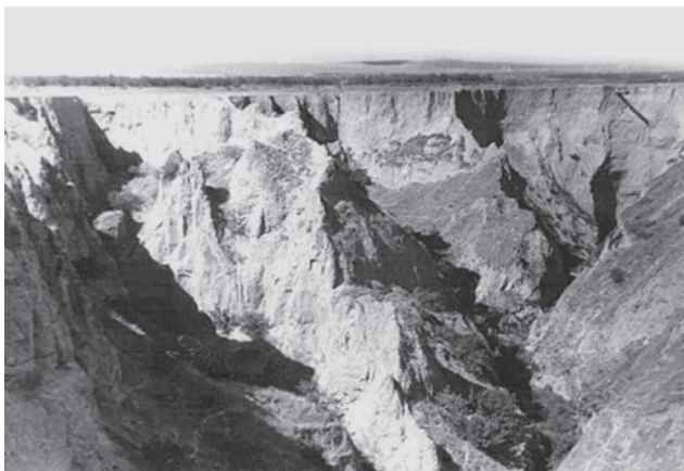
Рис. 1. Юго-Западный Таджикистан. Гигантский псевдокарстовый овраг глубиной более 100 м, сформированный в результате нецивилизованного сброса излишков воды с орошаемых полей.

Легко видеть современные изменения облика планеты Земля. В одних случаях эти изменения, казалось бы, улучшая среду, делают ее более удобной для жизни человечества (насаждение лесов, орошение пустынных земель, устройство заповедников и т.д.). В других случаях многие из преобразований – загрязнение среды, гибель целого ряда видов животных и растений, гибель биоценозов, истощение природных ресурсов – являются процессами, разрушающими биосферу. К сожалению, в настоящее время изменения второго типа резко преобладают. До 30% поверхности суши материков, а это сотни тысяч квадратных километров нарушены эрозийными процессами, горными выработками, или застроены [3].