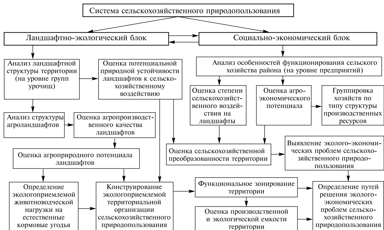
Рис. 1. Схема ландшафтного планирования для целей сбалансированного сельскохозяйственного природопользования.

Сложившаяся ситуация осложняется весьма нерациональной структурой земельных угодий и практически отсутствием экологоприемлемых систем ведения сельского хозяйства. Как известно, сбалансированное соотношение преобразованных и естественных ландшафтов в степной зоне должно составлять соответственно 60 и 40 % [4]. В Алтайском крае сельскохозяйственные угодья занимают 74,5 % территории степной зоны, а доля пашни составляет 65,5 % площади сельхозугодий. При этом в некоторых районах распаханность территории достигает 90 %, что чревато уже экологической катастрофой.