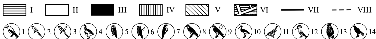
Рис. 2. Распределение редких и «интересных» видов птиц в городской и пригородной зонах Ангарска.

I — кварталы Ангарска; II — парковые зоны Ангарска; III — гаражные кооперативы; IV — пос. Стар. Китой; V — садоводства; VI — улицы Ангарска и автотрассы; VII — грунтовые дороги; VIII — лесные дороги. Орнитофауна: 1 — иволга обыкновенная в период гнездования, 1999–2004 гг.; 2 — сорока голубая в зимний период, 1999–2001 гг.; 3 — сорока голубая в период гнездования, 2003 г.; 4 — куропатка бородастая в осенне-зимний период, 1998–2000 гг.; 5 — неясыть длиннохвостая в зимний период, 2000 г.; 6 — неясыть длиннохвостая в период гнездования, 2001–2003 гг.; 7 — пищуха обыкновенная в зимний период, 1999–2003 гг.; 8 — сокол-дербник в зимний период, 1999–2003 гг.; 9 — сокол-дербник осенью, 2004 г.; 10 — черный аист в период гнездования, 2004 г.; 11 — дрозд-белобровик в мае–июне, 2001–2004 гг.; 12 — удод обыкновенный осенью 1995 г. и весной 2000 г.; 13 — филин обыкновенный зимой, 2000 г.; 14 — лунь болотный в период гнездования, 1999 г. и 2003 г.