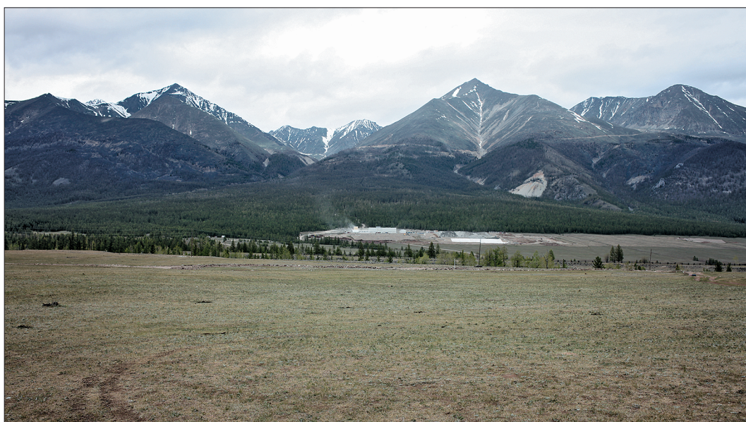
Рис. 2. Общий вид золотоизвлекающей фабрики ООО «Хужир Энтэрпрайз».

Пять из шести осваиваемых в настоящее время и уже действующих месторождений, исключая месторождение Тенгисийн-Дабан с размещенными в непосредственной близости горно-обогательными комбинатами и тремя золотоизвлекающими фабриками, находятся вне планируемых ТТПП и вне действующих и планируемых ООПТ. На рис. 2 представлен общий вид золотоизвлекающей фабрики ООО «Хужир Энтэрпрайз», а также просматривается дорога в виде серпантина к месторождению Коневинское с подземным горным рудником и обогащательной фабрикой в верховьях р. Сайлаг. На