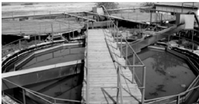
Рис. 1. Вторичные отстойники (илоотделители). На поверхности жидкости видны скопления всплывшего АИ.

Разработанное инженерное решение касается повышения эффективности работы сооружений биохимической очистки сточных вод и предназначено для использования на станциях очистки бытовых и промышленных сточных вод небольшой производительности. Цель такого решения — повышение эффективности очистки сточных вод в условиях неравномерного и периодического их поступления. Достигается это созданием нормального гидродинамического режима во вторичном отстойнике (илоотделителе) и поддержанием на необходимом уровне жизнедеятельности находящегося в нем АИ. Конструктивное инженерное решение узла рециркуляции АИ из вторичного отстойника в аэротенк позволяет повысить эффективность (по качеству) очистки сточных вод при условии их периодического поступления.