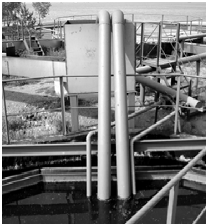
Рис. 2. Эрлифтная группа, установленная во вторичных отстойниках.

На рис. 3 представлена схема узла биохимической очистки сточных вод «аэротенк - вторичный отстойник» ( а ), фрагмент вторичного отстойника (илоотделителя) с эрлифтом при нормальной работе ( б ) и, как вариант, то же, при прекращении поступления сточных вод в блок ( в ).