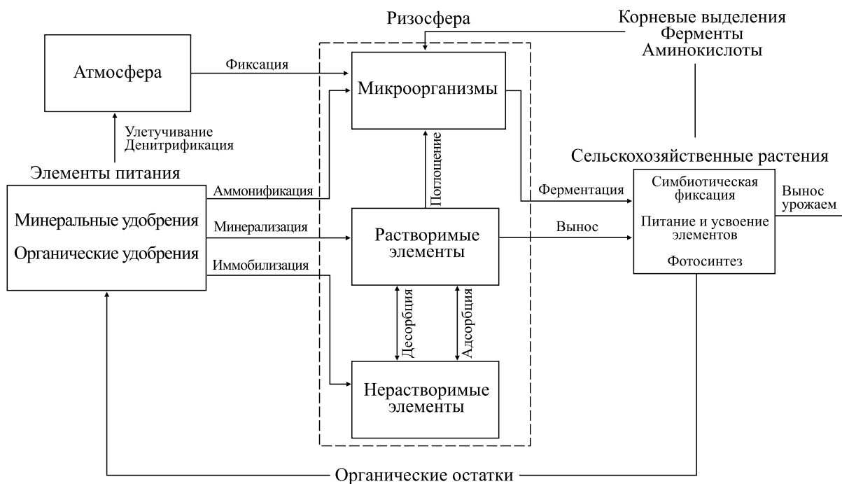
Рис. 1. Блок-схема модели химико-микробиологических процессов ризосферы.

ние удобрений в наиболее благоприятные фазы роста растений. Вопрос о распределении растворимых и нерастворимых форм питательных веществ, а также их связь между собой и растением был рассмотрен лишь в ограниченном числе случаев и не имеет дополнительных связывающих факторов между системой «питательный элемент–почва–растение». Также стоит отметить отсутствие методов и алгоритмов решения задач параметрической идентификации моделей (способов оценивания численных значений параметров модели) и проверки степени адекватности изучаемым реальным системам.