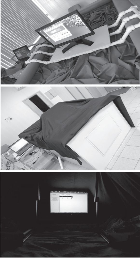
Рис. 1. Демонстрация условий «сухой» иммерсии и предъявления стимулов в эксперименте с оценкой контрастной чувствительности зрительной системы в разных диапазонах пространственных частот.

ских операций и выполнение профилактических мероприятий. Один раз в день испытуемых извлекали из ванны и укладывали на каталку в строго горизонтальном положении для проведения гигиенических процедур, занимавших не более 15 мин.