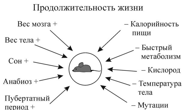
Рис. 1. Основные положительные и отрицательные факторы, удлиняющие или укорачивающие жизнь животных.

Итак, на ПЖ влияет (положительно или отрицательно) целый набор важных факторов (рис. 1). Для расчета ПЖ позвоночных животных мы предлагаем следующую многопараметрическую эмпирическую формулу: