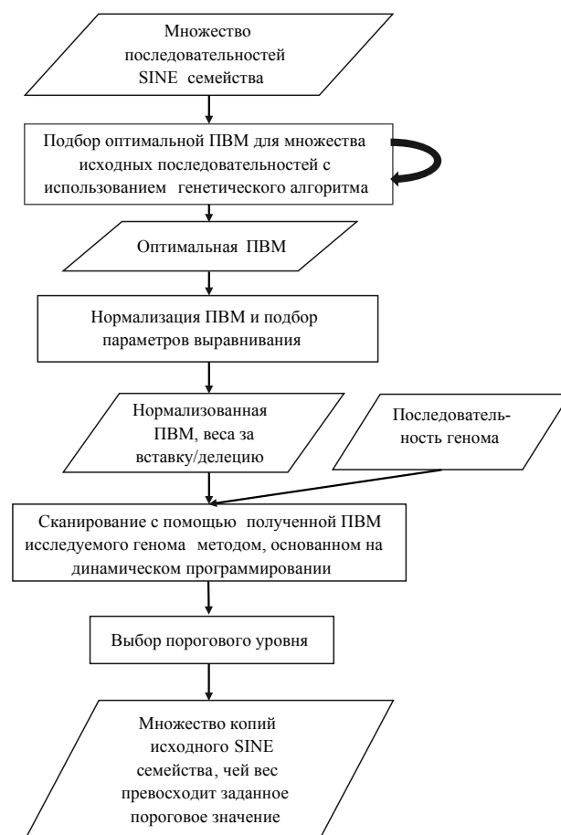
Рис. 1. Схема работы МПСДП.

На втором этапе происходит нормализация ПВМ и подбор параметров. На третьем с помощью полученной ПВМ производится поиск повторов в последовательности генома с использованием модифицированного метода динамического программирования [15].